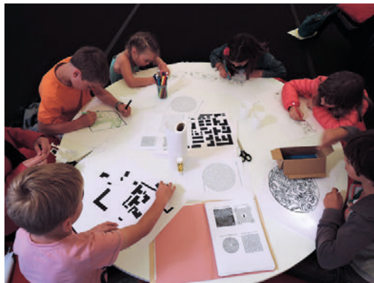
Atelier du Radôme, été 2016

Les expositions présentées au LiFE sont ouvertes à tous. Elles sont libres d'accès, tout comme l'ensemble des activités proposées.