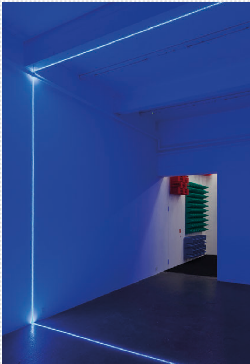
Haroon Mirza, Digital Switchover , 2012 - Vue d'installation à \\\ \\\ Kunst Halle Sankt Gallen, St.Gallen (Suisse), 2012

Réservation pour les groupes scolaires : 02 40 00 40 17