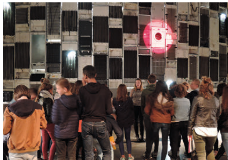
Visite accompagnée d'une classe dans le cadre de l'exposition du collectif raumlaborberlin Neocodomousse, 2016